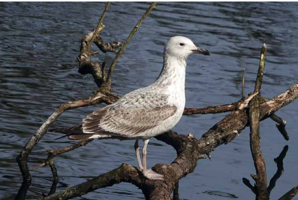
Pontische meeuw - 1ste jaars

Voer je eigen waarnemingen ook in, ze kunnen belangrijk zijn, en wie weet, misschien ook voor opname in een volgend vogelverslag