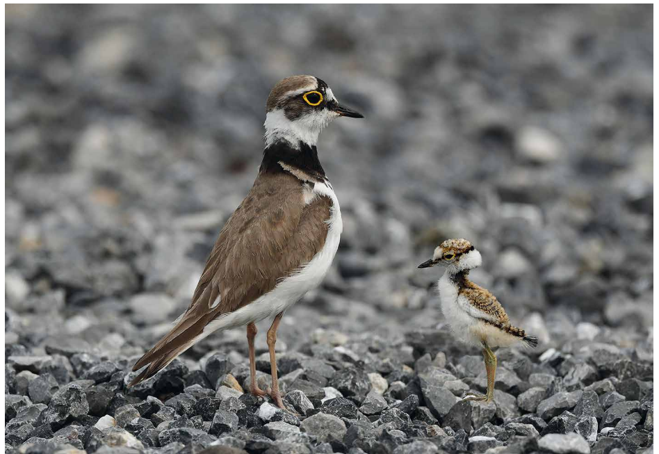
Kleine plevier met pulli - Foto: Walter De Weger

mei in een private tuin nabij Fort VI – Wilrijk (JE).