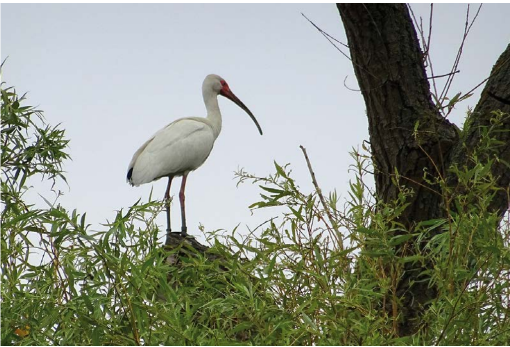
Witte ibis - Foto: Luc De Meyer