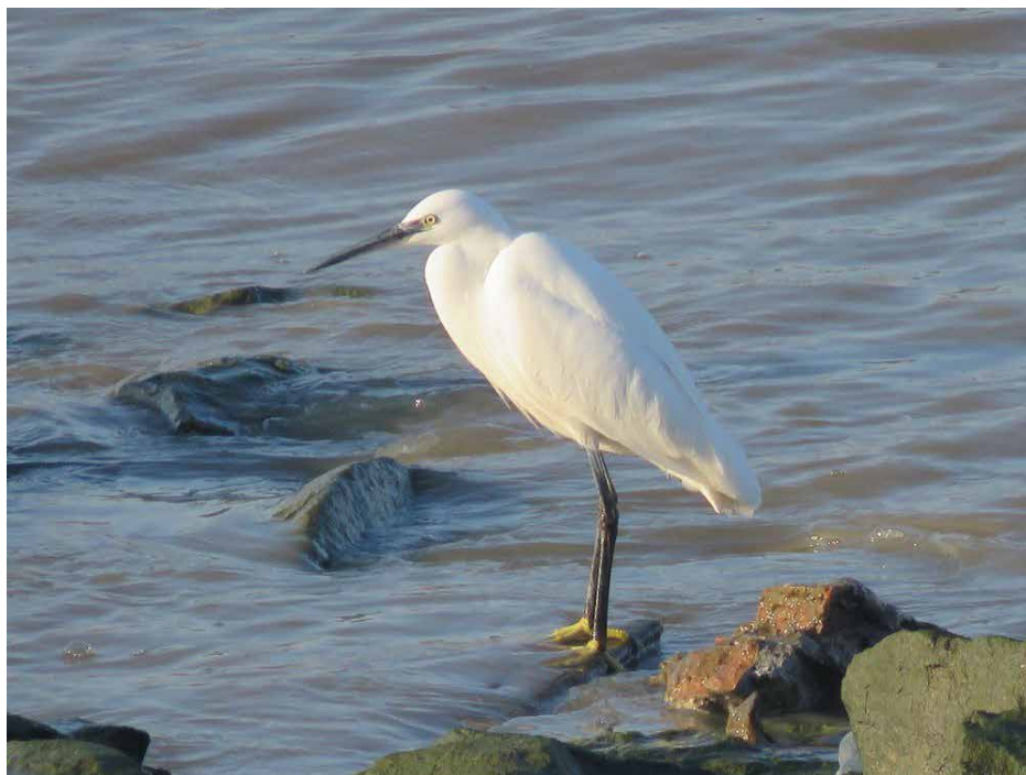
Kleine zilverreiger

Op 19/1 vloog een havik over het Uilenbos/Hove (RM).