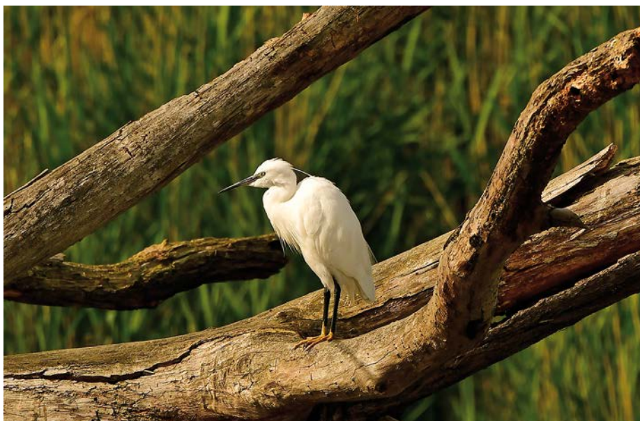
Kleine zilverreiger

over Kontich op 7 jan. (KM) Dit is een nieuwe soort voor onze regio, maar de waarneming werd (nog) niet beoordeeld bij de samenstelling van dit verslag.