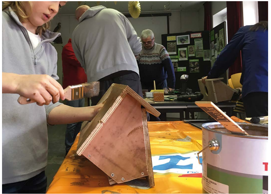
Een nest voor de gierzwaluwen timmeren

workshop in de IJsvogel (de vogel die vermoedelijk genoemd werd naar de temperatuur van het lokaal!), op 9 maart. We hadden het gehad over grootse ideeën (om heel het Albertkanaal te voorzien van nestkasten, op te hangen onder de nieuwe bruggen) en over de moeilijk te nemen drempels die dan rijzen, zoals de logheid van overheidsapparaten. Waar te beginnen, wie beslist, wat als er niemand reageert etc.? We hielden de moed erin, door het besef uit te spreken dat we als grote vereniging wel degelijk een project in gang kunnen sturen. En dat ook de overheidsinstanties evolueren: ook zij willen 'vergroenen', en meer en meer jonge ambtenaren trekken ook in die echelons aan de kar. Hoopgevend. 'Maar hoe zit het dan met ons, stelde P. de vraag, want als ik binnen de vereniging rondkijk zie ik toch heel veel grijs haar!'. Gelukkig was daar den Tolle. 9 jaar en actief als gierzwaluwkast-schilder. 'Ik wil zo'n bak aan ons huis!' zei hij kordaat. Dat was duidelijk, qua engagement. 'En ik zie toch ook heel veel positiefs vloeien uit de klimaat-spijbelars-beweging', zei Johan, die als pas gepensioneerde nu voltijds en vrijwillig werkt als gierzwaluw-deskundige in Antwerpen Stad en omgeving. 'Het is inderdaad te hopen dat deze jongeren niet enkel op straat komen uit eigenbelang, zoals mevrouw V. al borend en schroevend opmerkte, maar ook een breder perspectief, het beschermen van de planeet en de natuur om zich, voor ogen houden!'. We hoopten alleszins