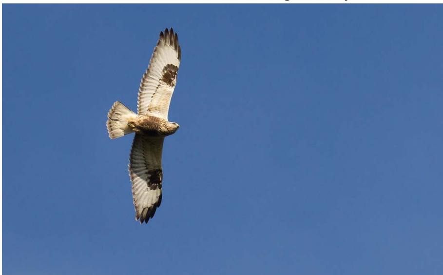
Ruigpootbuizerd - Foto: Rudy Vansevenant

Een mannetje ringtaling pleisterde op 30 december in het Park Weyninch-hove-Hove (GC).