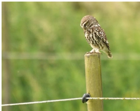
STEENUIL TE EDEGEM