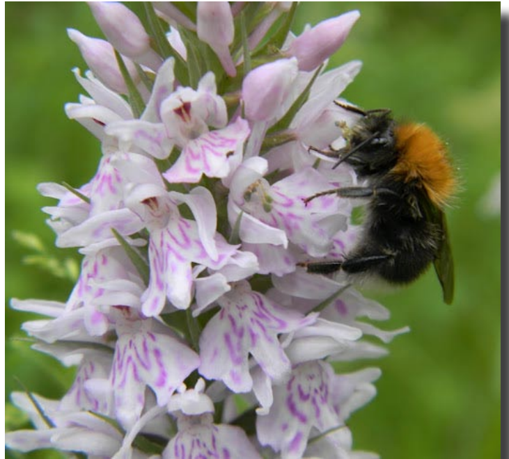
Akkerhommel op bosorchis

We gaan de berg op, slaan een wandelpad in en komen al snel aan een eerste "grot", de ingang van een oude, verlaten groeve voor de ontginning van mergel als bouw materiaal,