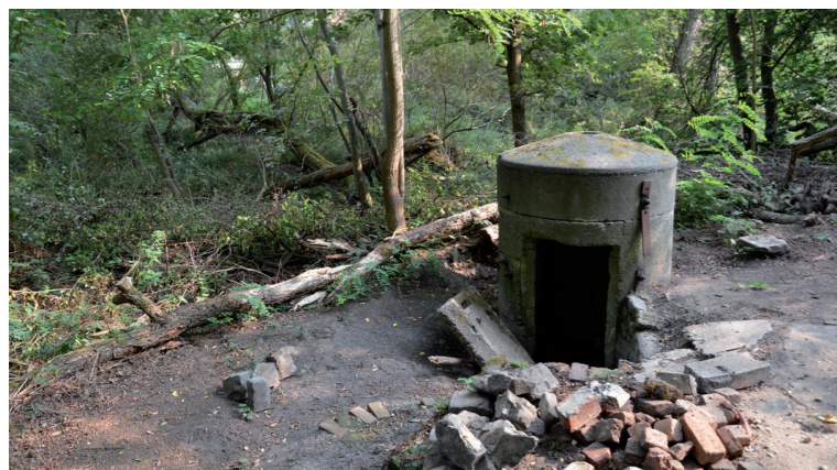
Bunkertje in de Tarzanboskes

NU INSCHRIJVEN voor de wandeling op zaterdag en het feestmaal !!!