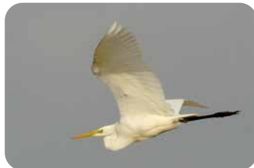
Grote zilverreiger vliegt over de trektelpost van vogelwerkgroep ARDEA op de Scheldedijk

se overheid en de stad Antwerpen kan Natuurpunt de Hobokense Polder uitbouwen tot een waardevol natuurgebied waar iedereen welkom is.