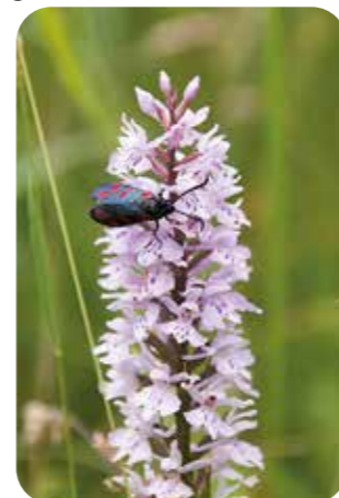
Sint-Jansvlinder op bosorchis

Opvallend in een bloemrijk grasland zijn de bloeiende orchideeën. Vele soorten zijn in de twintigste eeuw achteruitgegaan. Waar eertijds vele graslanden in mei en juni gekleurd waren door orchideeën, zijn ze nu vaak beperkt tot natuurgebieden. Een soort