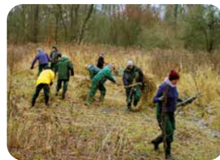
Onze Goudklompjes aan het werk

De natuur rekt op een groep vrijwilligers en professionele medewerkers van Natuurpunt die het gebied beheren. In het grootste deel van de Hobokense Polder mag de natuur haar gang gaan. Dit is vooral waar je bos en struweel vindt. De gras- en rietlanden worden wel beheerd om te vermijden dat alles evolueert naar bos.