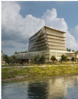
Simulatie van de campus

Natuurpunt Hobokense Polder, dat het natuurgebied beheert, heeft zondagmiddag actie gevoerd tegen de Maritieme Campus Antwerpen (MCA). Dat bedrijfsterrain moet tegen 2023 dé plek worden voor onderzoek naar de vergroening van de scheepvaart. Maar Natuurpunt vreest dat het project een te grote impact zal hebben op de Polder rond het terrein.