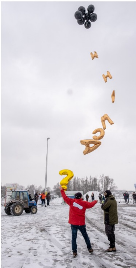
Ballonnen stijgen op tot de geplande hoogte van het complex.

Vergunning gevraagd Scheepvaartbedrijf CMB heeft