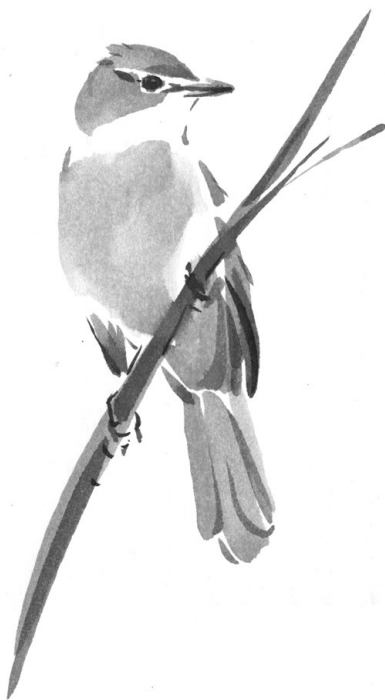
GROTE KAREKIET TEKENING: ERIK VAN OMMEN

'De Landelijke Dag is een jaarlijks evenement voor alle vogeltellers en andere actieve natuurliefhebbers in Nederland. Ruim 2000 bezoekers komen naar de Landelijke Dag die een platform biedt om elkaar te ontmoeten, kennis en ervaring uit te wisselen en nieuwe mensen te betrekken bij het onderzoek naar vogels'. Dat is de aankondiging van SOVON Vogelonderzoek Nederland zelf, maar ARDEA ontdekte al 4 jaar geleden dat dit ook geldt voor Vlaanderen. Wat de Nederlandse vogelonderzoekers op zo'n dag presenteren in mooi geïllustreerde praatjes (korte lezingen van 15 à 25 minuten) over vogels is indrukwekkend. Een dag vol voordrachten met topsprekers uit de wereld van vogelonderzoek (Nederland, UK en vaak ook België...) en meer dan 80 stands met boeken, optiek, reizen en vogelorganisaties. Hoe het precies zit met de opkomst van de Bijeneters, de achteruitgang van de Zomertortel, de aanpak van exotische ganzensoorten, dwergsterntjes in Zeeland, de redding van de Grauwe kiekendief...? Het zijn maar enkele losse grepen uit de tientallen onderwerpen van de voorbije jaren. Het inspireert ons als vogelwerkgroep bij de opzet van lokaal onderzoek en projecten, en het motiveert om te zien hoe grondig de aanpak, hoe groot het draagvlak en hoe zinvol het vogelonderzoek kan zijn. En ben je op zoek naar dat éne net nieuwe of stokoude vogel- of natuurboek, een idee voor je volgende natuurreis of wil je alle optica-merken eens grondig vergelijken? Hier moet je zijn!