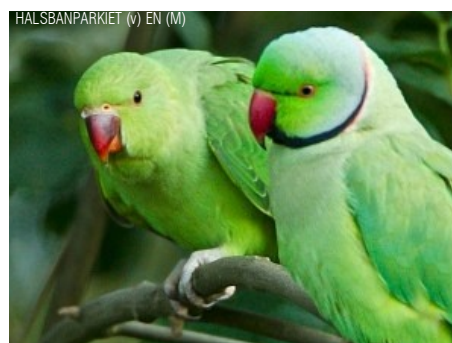
HALSBANDPARKIET (V) EN (M)

Het vrijlaten van niet inheemse planten en diersoorten kan tot nefaste gevolgen leiden voor het milieu waarin zij worden vrijgelaten. Meestal hebben deze exoten geen natuurlijke vijanden en slagen zij erin om zich toch aan te passen en te vermenigvuldigen in hun nieuwe biotoop. Dit ten nadele van de inheemse fauna en flora. Denk maar aan de grote problemen die Australië heeft om zijn eigen kwetsbare fauna en flora te verdedigen tegen de ingevoerde dieren.